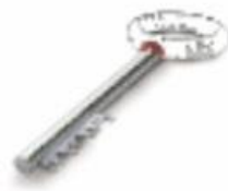
▶ กุญแจบ้าน, กุญแจรถ