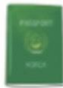
▶ มีถนประชาชน, มีควลางควว, หนังสือเดินทาง