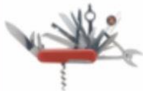
▶ มีดพับสวิตช์ประโชน