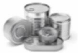
▶ อาหารฉุกเฉิน