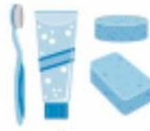
▶ ของใช้เพื่อสุขอนามัย (แปรงสีฟัน, สบู่, ยาสีฟัน, สบู่)

※ หากมีผู้สูงอายุหรือคนพิการ ควรติดต่อสถาบันที่ช่วยเหลือของพื้นที่นั้นไว้เป็นกรณีฉุกเฉินด้วย